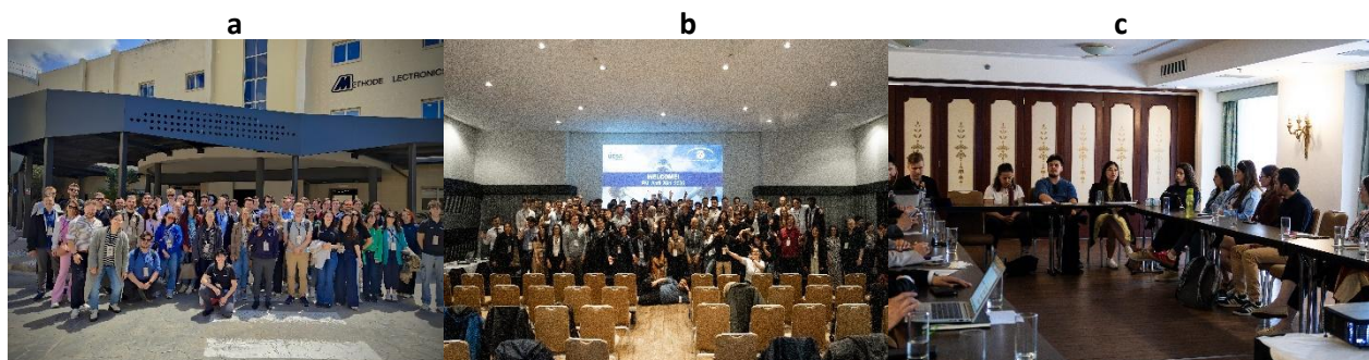
Slika 3. Prvo učešće predstavnika SHI na EYE konferenciji na Malti –:(a) učesnici konferencije u stručnoj poseti, (b) zajednička fotografija učesnika i (c) sastanak Upravnog odbora