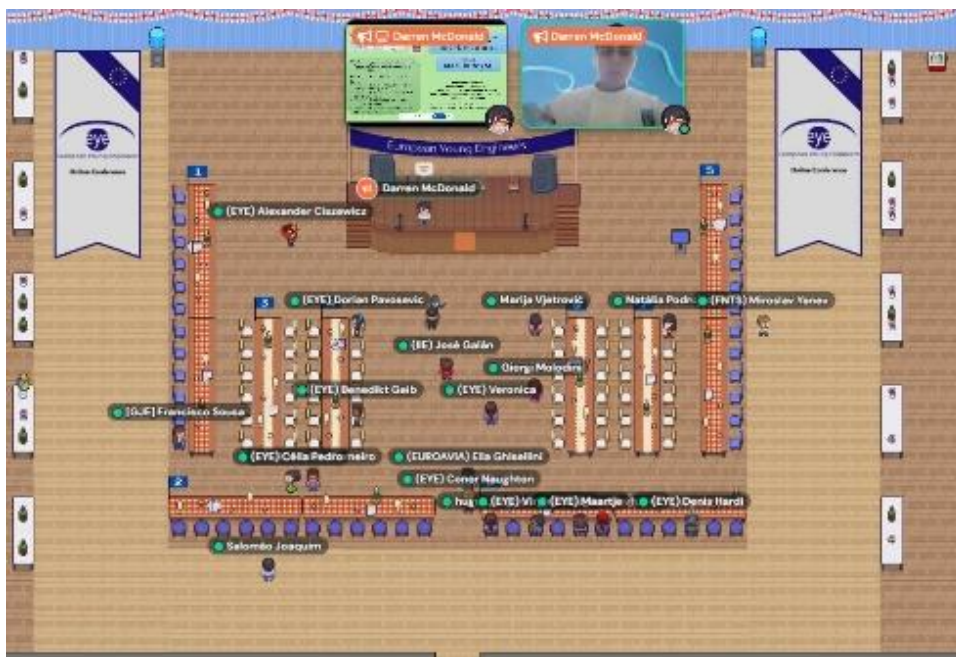
Slika 2. Prikaz platforme organizacije EYE za održavanje vebinara, kao savremeni format za prezentaciju projekata i diskusiju

Vebinari predstavljaju potpuno drugačiju, savremenu i dinamičnu platformu za razmenu znanja (Slika 2). Oni su osmišljeni kao interaktivni virtuelni događaji, gde učesnici, posebno studenti i mladi istraživači, imaju priliku da predstave svoje projekte, radove i istraživačke panele, diskutuju o rezultatima i dobiju povratne informacije od kolega iz različitih zemalja i oblasti. Ovakav format podstiče aktivno učešće, razvija veštine prezentovanja i kritičkog razmišljanja, ali i omogućava lakše povezivanje sa potencijalnim saradnicima iz međunarodnog okruženja.